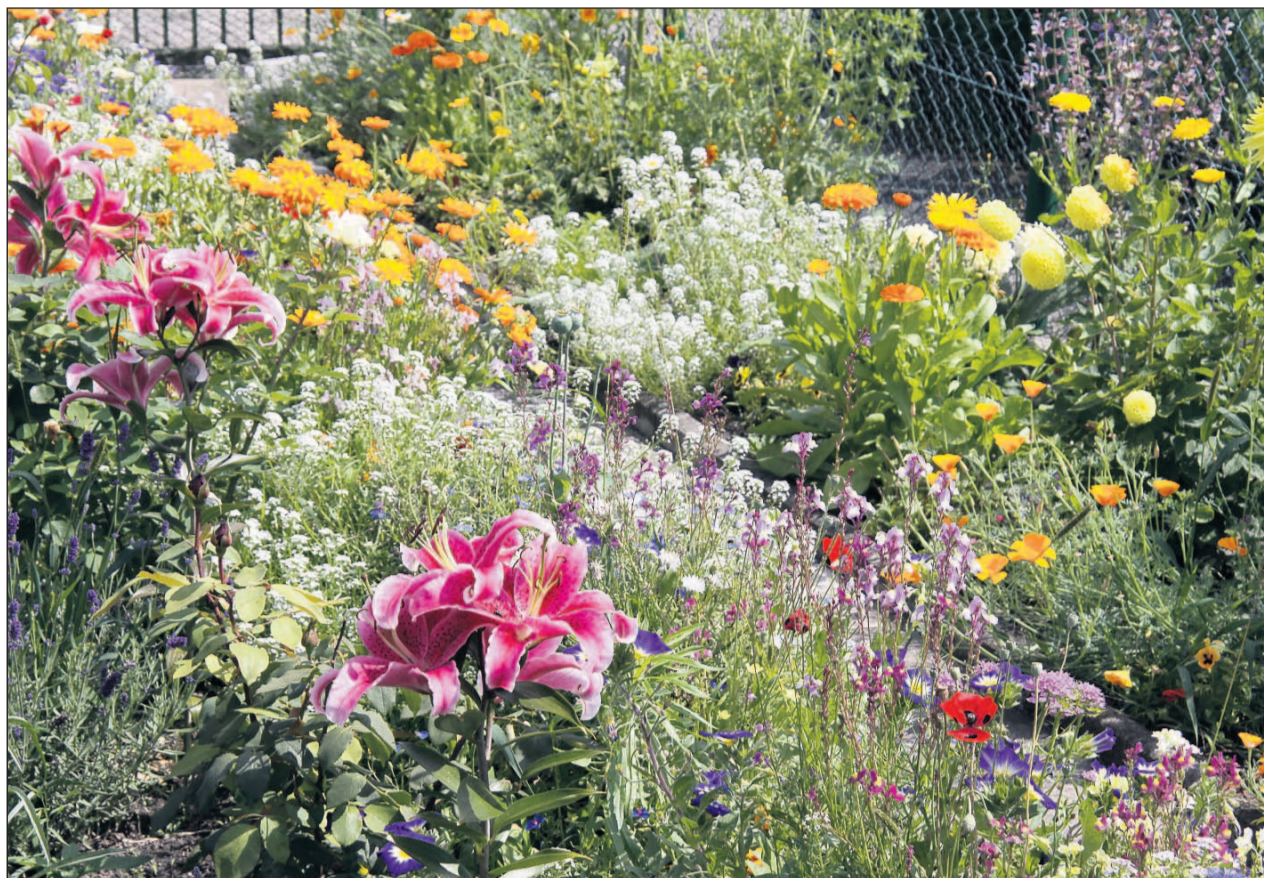
Die einjährigen Sommerblumen werden ergänzt von ausdauernden Lilien, die jedes Jahr wieder blühen.

Wer die Samen nicht einzeln säen will, kann sich in den überall angebotenen Saatgutsortimenten