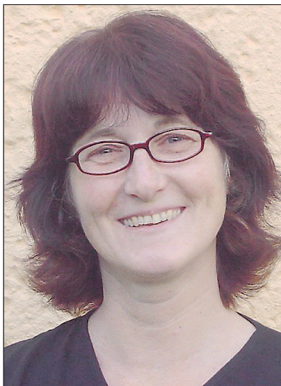
Birgit Klaunder