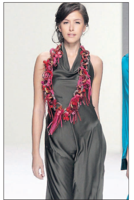
Sanft fließende Seide betont die Silhouette.