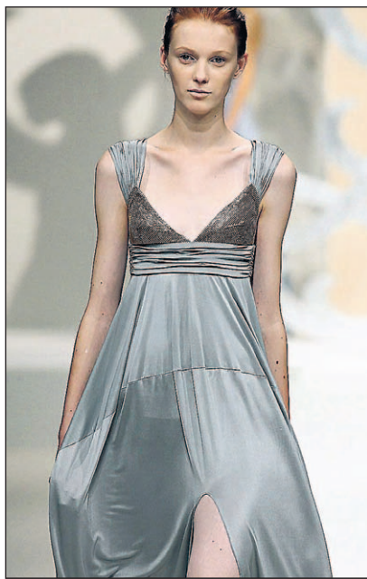
Dieses Kleid im Empire-Stil setzt die Taille optisch nach oben.